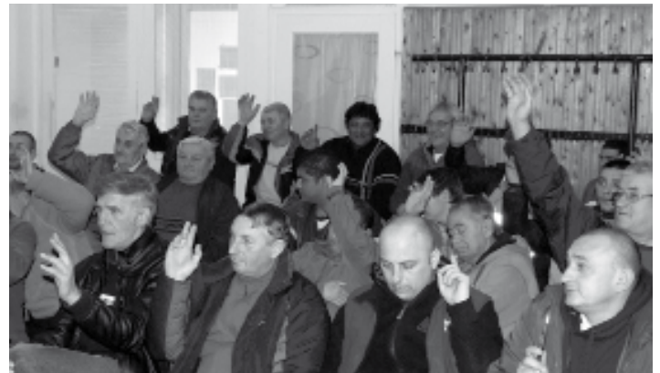
Több témakör átbeszélése után a tagság megalapítására szolgáló döntések születtek