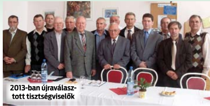
2013-ban újraválasztott tisztségviselők