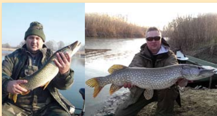
Nagy fogások a páros, csónakos csukafogó versenyen./5.