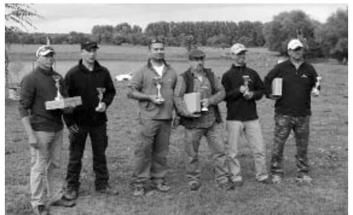
Az első három helyezett serleget és ajándécsomagot kapott