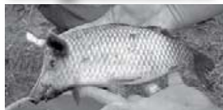
Valaki vicces kedvében volt

Két horgász beszélget. Az egyik azzal dicsekszik, hogy a tóban milyen sok halat fogott már. A másik megkérdezi: