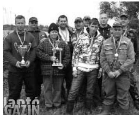
A Megyei I. osztályú Csapatbajnokság I. helyezette, a Nagyállói csapat