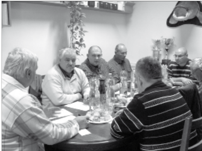
Ülésezett a Verseny Szakbizottság.