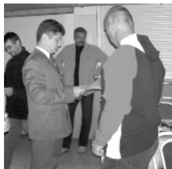
Újra vizsgálni kell a halórknek

A régi szolgálati igazolványok május 1-től hatályukat veszítik. Ezért fontos az, hogy az új igazolványokat és a szolgálati jelvényeket a halór megbízója, vagy a foglalkoztatója minél hamarabb kérvényezze a megyei rendőrkapitányság igazgatási rendszeti osz-