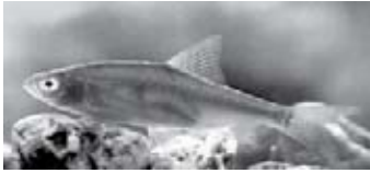
Alampiás bodorka, amelynek bőréből hiányoznak a gyöngyházfényű guaninkristályok