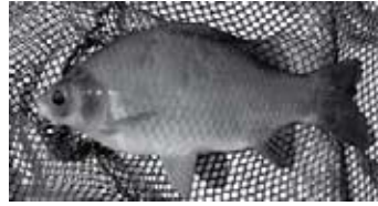
Ezüstsín nélküli ezüstkárász, pikkelyein csak a melanin sötét színe látszik