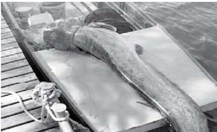
A nagy harcsa vesztét okozta a túl nagy falat