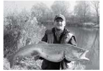
Ez a kép nem a Tiszán készült, de itt is el lehetne képzelni