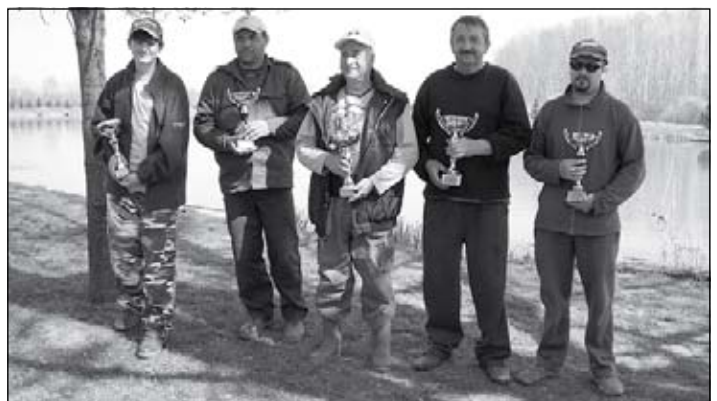
A KOCSORDI Tavasz kupa győztesei