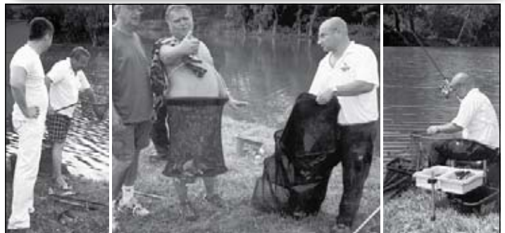
NEMZETKÖZI VERSENY. Bodrogszerdahelyen tartott nemzetközi horgászversenyen a megyei szövetségünk is képviseltette magát egy csapattal.