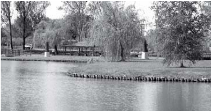
Egy látkép a tóról