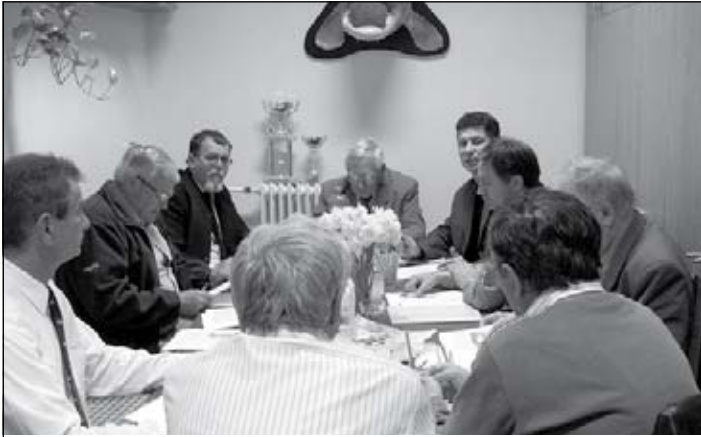
MEGVITATTA AZ ELNÖKSÉG IS A BESZÁMOLÓT.