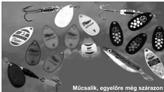
Műcsalik, egyelőre még szárazon

A hordalékoktól elszíneződött vagy a tőzegek, (vörösesbarna) vizek hatása más, itt a piros műcsalik kivilágosodnak, de