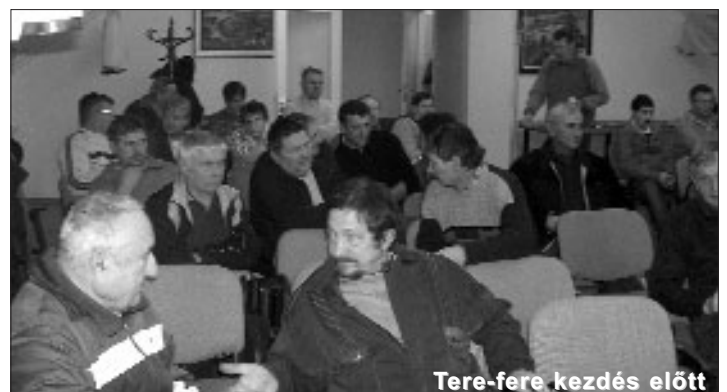
Tere-fere kezdés előtt