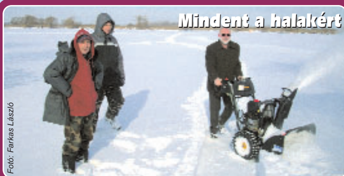
Mindent a halakért

Nádvágás, hómarás, lékelés a minél oxigéndúsabb víz eléréséért a kisvárdai Dolgozók HE tagjai mindent elkövetnek