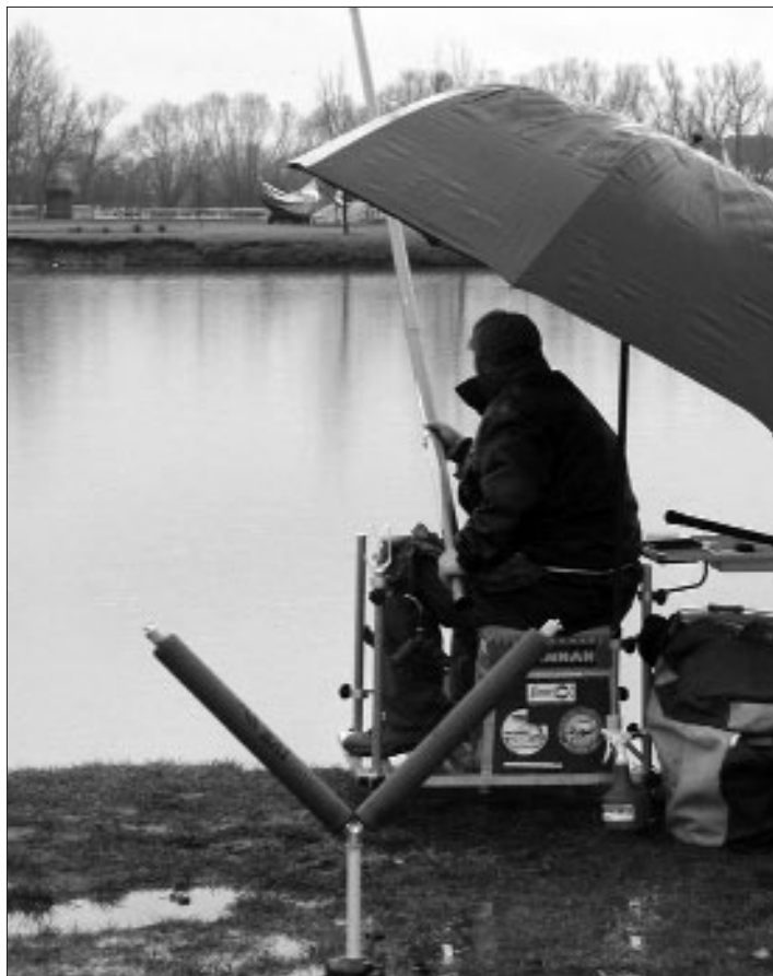
Extrém körülmények a parton. Akár úszhatnánk is egyet a ládák között

csont nélkül kibújni a holnapi részvét alól – tudatják velem az ítéletet –, de abban azért sikerül megegyezni, hogy, szakadó esőben (és viharos szélben) mégsem kéne nekiindulni. Kezd lelkiismeretfurdalásom lenni a sok rinyálás miatt. Többen szervezik a dolgot, én meg mint egy puhány takonypóc, sírok az idő miatt. A többieknek is rossz idő lesz, nemde? Ha ők odaállnak, és becsülettel helytállnak, akkor nekem is illene. Két képzeletbeli saller után, amit kíméletlenül kiosztottam magamnak, bepakolom a kocsiba a szükséges felszerelést. Gyors va-