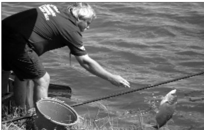
Szép busa, de ez itt most mit sem ér