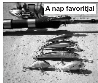
A nap favoritjai

A reggeli nap fénye zöldesen csillogó köntösébe öltöztette a folyót. A méteres vízben snecik járták táncukat. A meder kavicszemekkel kirakott aljzatán elpusztult kishal teteme pihent, várva arra, hogy egy ragadozó által újra bekerüljön a természet