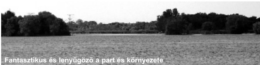
Fantasztikus és lenyűgöző a part és környezete