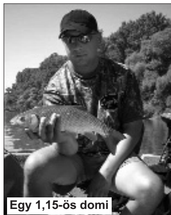
Egy 1,15-ös domi

val, de a nap egyetlen balinocszkáját is neki köszönhetem. Közöttünk kialakult kis házi versenyünk során a maga 500 pontjával sokat nyomott a latban, ugyanis a domikra csak 50 pontot számolhattunk. Dél körül mindhárman túl voltunk a 10-12 halunkon és egy kis pihenő mellett döntöttünk. Egy sóderpadon kötöttünk ki, ahol megebédeltünk és szunyókáltunk egy kicsit az árnyékos partoldalban.