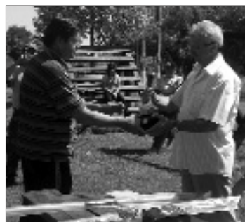
Felnőtt első helyezett