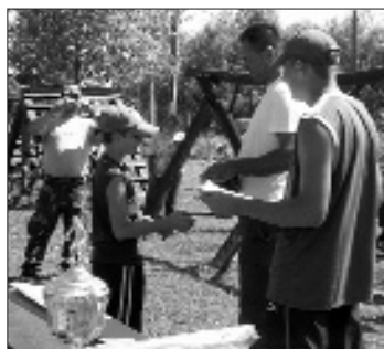
Utánpótlás első helyezett