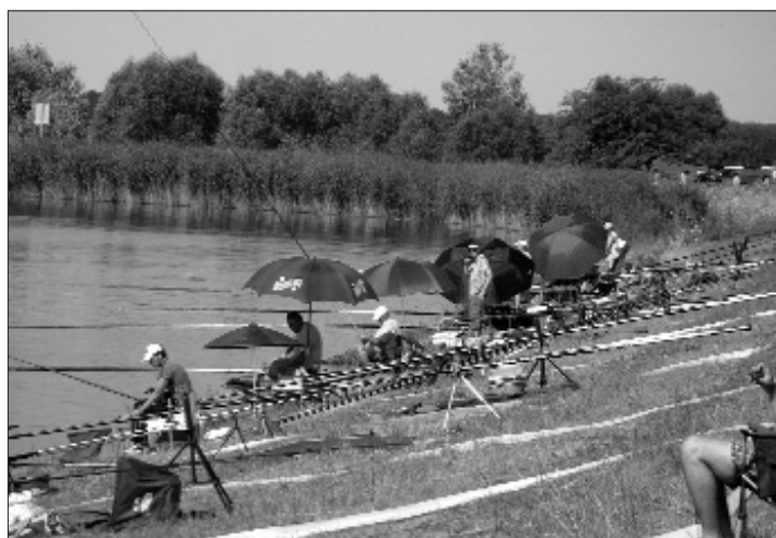
A lezárt partszakasz, csak a versenyzőknek nyílt meg