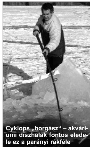
Cyklops „horgász” – akváriumi díszhalak fontos eleme ez a parányi rákfélé