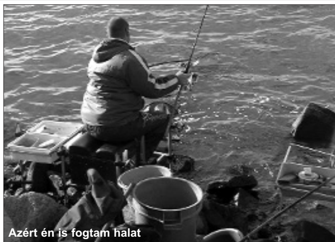
Azért én is fogtam halat