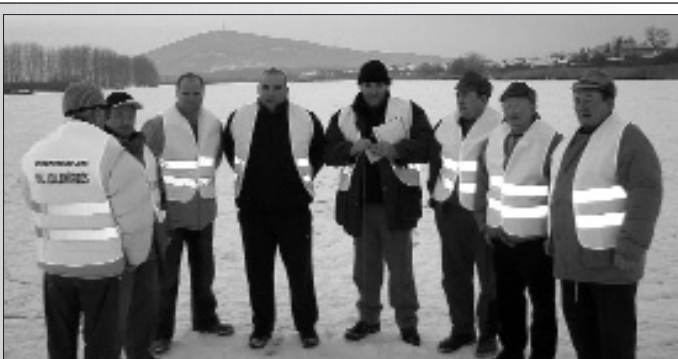
11 fő halászáti ór vizsgázott a Cormoran S.T.E -nél a rakamazi halászáti vizek jobb őrzése érdekében.

Akció a bújtosi horgász egyesületnél Halásítási hozzájárulás március végéig 50% kedvezménnyel, csak 12 ezer forint!