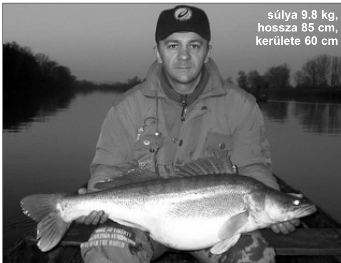
súlya 9,8 kg, hossza 85 cm, kerülete 60 cm