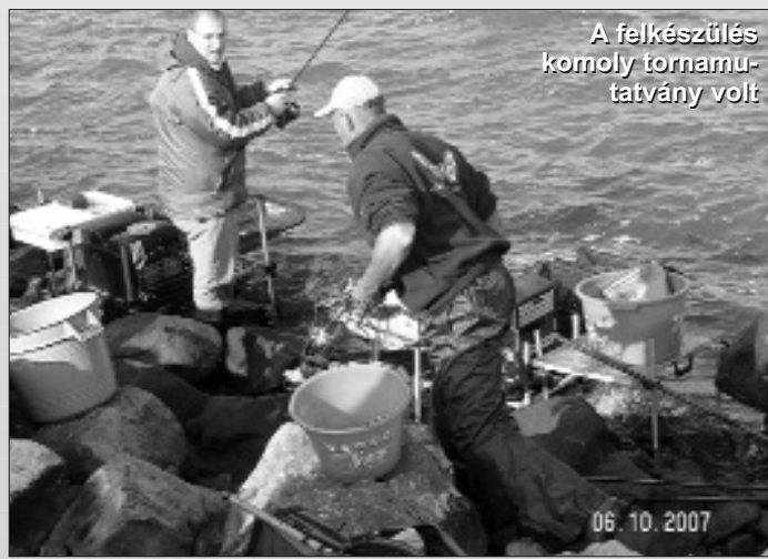
A felkészülés komoly tornamutatvány volt