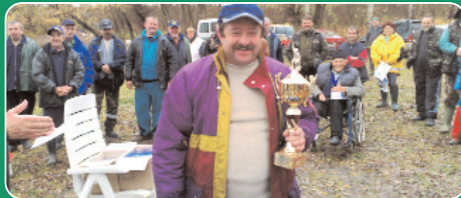
„Nyír-Márvány” Kupa Csukafogó Verseny Gávavencsellőn./14. o.

Eredményekben gazdag boldog új évet kíván olvasóinak a Villantó Magazin!