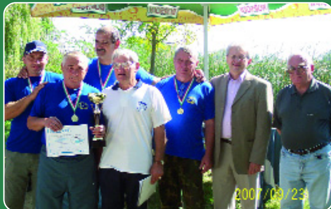
A győztes csapat