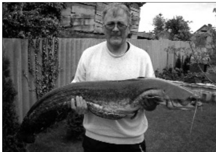
A tőrekord, 11,5 kg-os harcsa

Tovább akarják javítani a kollektívát is, bár tapasztala-