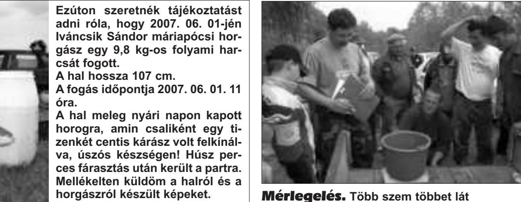
Mérlegelés. Több szem többet lát

A hal meleg nyári napon kapott horogra, amin csaliként egy tizenkét centis kárász volt felkínálva, úszós készsége! Hús perces fázasztás után került a partra. Mellékelten küldöm a halról és a horgásról készült képeket.