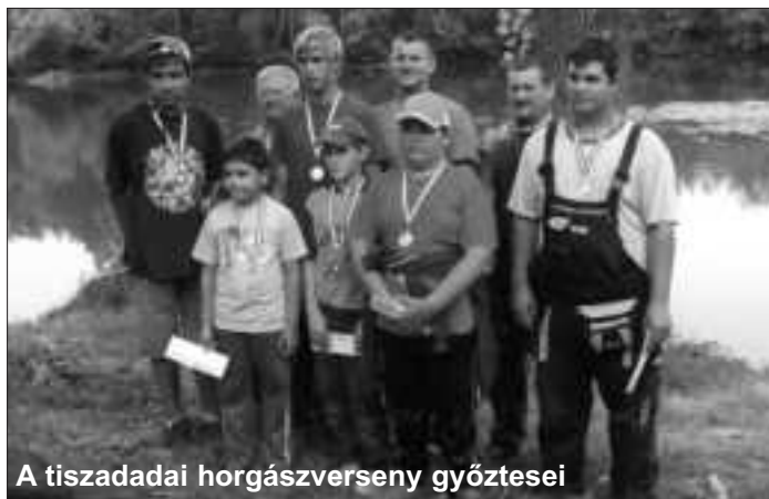
A tiszadadai horgászverseny győztesei

1946-ban került horgászkezelésbe az első jelentős hor-