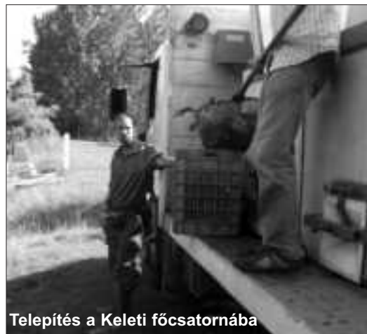
Telepítés a Keleti főcsatornába

Megegyi Szövetségünk az elmúlt év folyamán az igények alapján ellátta nyomtatványokkal, engedélyekkel a horgászegyesületeket, társszövetségeket, valamint a bizományosokat. Az egyesületi, bizományosi elszámolások rendben megtörténtek. Szövetségünk a szerződésekből foglalt határidők betartásával eleget tett a havi-és éves elszámolási kötelezettségeinek a MOHOSZ, FVM, Szabolcsi Halászati KFT, és halászati szövetkezetek felé. Teljesítettük a ránk háruló járulékok határidőre történő lejelentését, befizetését a hatóságok felé. Az