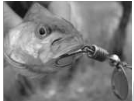
A várva várt idej első sügérme Mepps-en

A fásasztás nem tartott tovább két-három percnél, s barátom a tarkójánál fogva a partra emelte a kilón aluli csukát. Természetesen harapásálló előkét nem használtam, hiszen sügerezéshez felesleges, csak eldurvítja a finom szerelékem. A szerencsém az volt, hogy oldalt a pofája külső ívébe beleakadt a damil így elkerülte a borotvaéles fogsort. Egy fénykép és már boldogan távozhatott is.