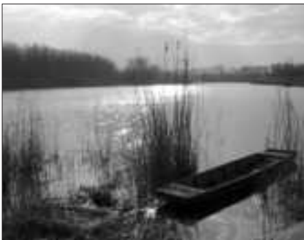
Reggeli borongás, bennünk és a tájon is

Nagyon jó híreket kaptam. Kellemes, szélcsendes időjárást jósoltak a hétvégére, „kirándulóidőt”, hogy pontosan idézzem, 16 °C körüli hőmérséklettel. Ilyen pompás időben kár otthon ülni. Gondolatban már a vízparton voltam, miközben néhány sügérre legettem. Már alig vártam, hogy elteljen a pénteki nap és másnap útra kelhessek.