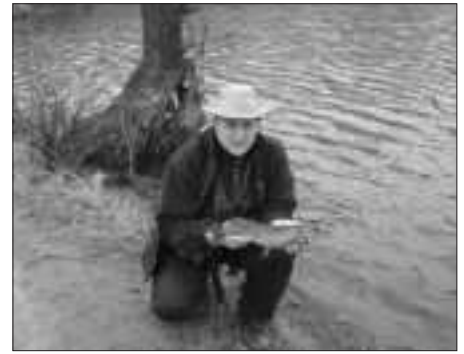
Fotó után szabadon

Félórányi dobálás után egy ránehezedést éreztem. Megemeltem a bot spiccét és valami visszarúgott, miközben karomban éreztem lassú, de ellentmondást nem ismerő egyenletes húzását. A féket elég kicsi értékre állítottam, hátha egy nagyobbacska sügér „megénekelte” az orsóm. Egyébként sem szeretem a víz tetején kiszánkóztatni még az apróbb sügéreket sem.