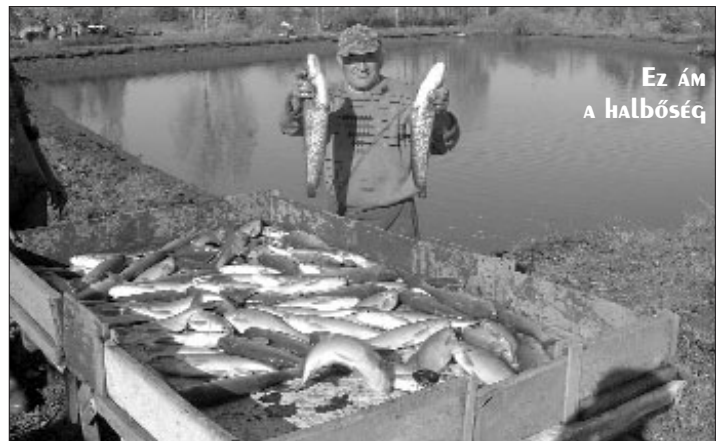
Ez ÁM A HALBŐSÉG