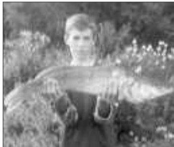
A tábor legnagyobb hala egy 3,5 kg-os süllő

Az elmúlt évekhez hasonlóan idén is két turnusban érkeztek a megye különböző egyesületeiből a horgászni szerető fiatalok. Az első turnusban komoly szponzori támogatást nyújtott a Laguna 2-D Kft., amellyel az idei tábor színvonala jelentősen nőtt az elmúlt évekhez képest.