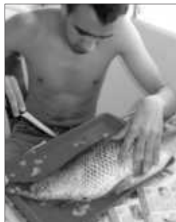
Aki megfogta, az pucolja is meg! – vallják nagyon sokan